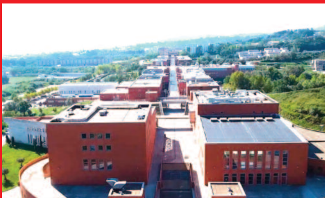
Unical - Via Pietro Bucci - Arcavacata di Rende

In auto: Autostrada A2 Salerno-Reggio Calabria --> Uscita Rende - Cosenza Nord, seguire le indicazioni per Università